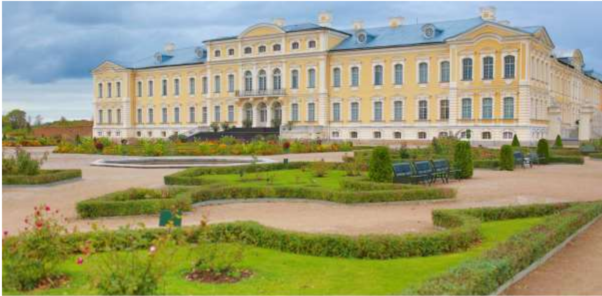
วันที่ 4 พระราชวังรูนดาเล่ - เทียวชมเมืองริกา - ปราสาทริกา - House of Blackheads