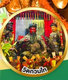
วัดกวนโก ขอพรเทพเจ้ากวนอู เงินทอง, ธุรกิจมั่นคง