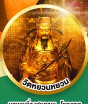
วัดหยวนหยวน ขอพรเรื่องสุขภาพ, โชคลาภ ความเจริญก้าวหน้า

เมนูพิเศษ! ต้มช้ำฮ่องกง, บุฟเฟ่ต์ชาบูสไตล์ฮ่องกง, ห่านย่าง