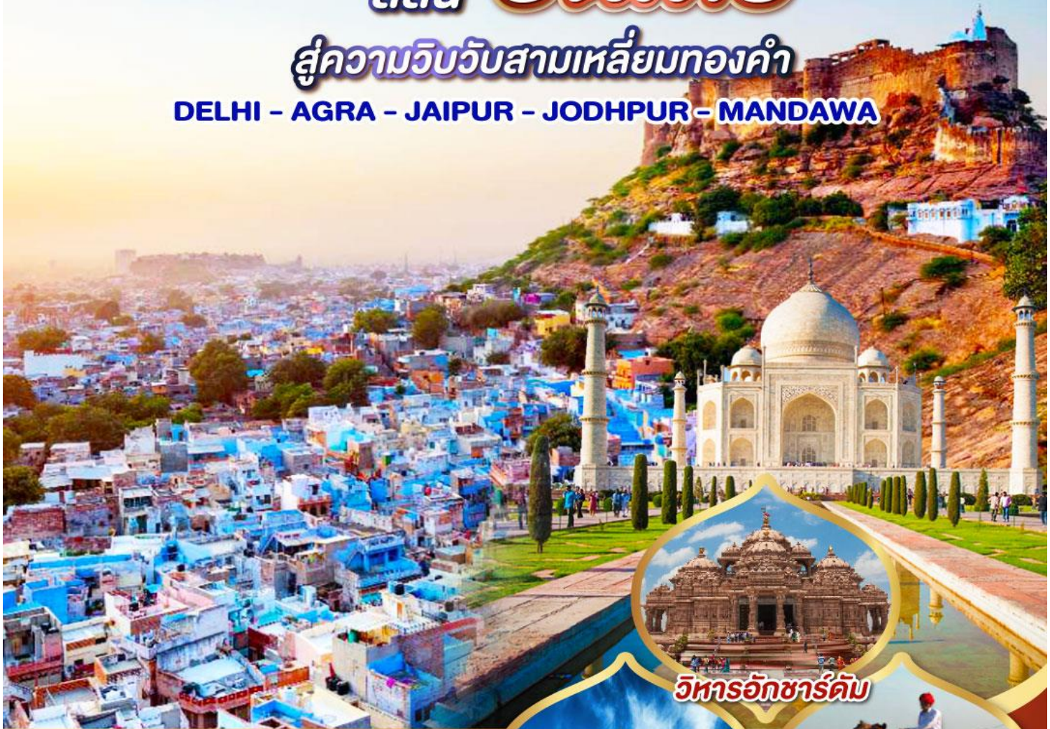
วิหารอักขารัตม์

DELHI - AGRA - JAIPUR - JODHPUR - MANDAWA