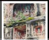
หินแกะสลักหนานคาน

PERIOD 1 : 13 - 17 ต.ค. 2569 PERIOD 2 : 17 - 21 ต.ค. 2569