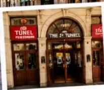
สถานีอุโมงค์ (TUNEL STATION) สถานีรถไฟใต้ดินสายเก่าแก่และเป็นหนึ่งในระบบขนส่งที่เก่าแก่ที่สุดในโลก