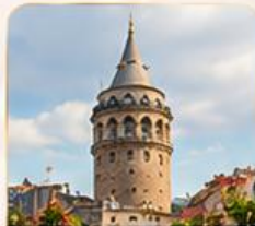
GALATA TOWER หอคอยกาลาตา