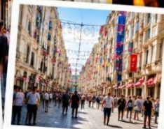
ISTIKLAL STREET (Grand Avenue of Pera) ถนนสายช้อปปิ้ง ยืน 88 ตรกม.ในทีเดียว