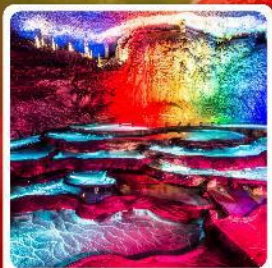
ถ้ำเก้าเทพ

ไฮไลท์! หมู่บ้านชาวนเซียเหรินเจีย หมู่บ้านโบราณฝูหรงเจิ้น ถ้ำเก้าเทพ ล่องเรือทะเลสาบผิงหู สวนถ้ำสามสหาย