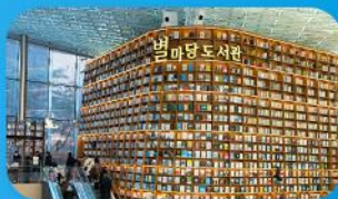
ห้องสมุดสตาร์ฟิล