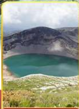
ปากปล่องภูเขาไฟซาโอ