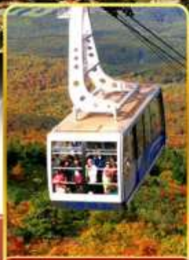
นั่งกระเช้าอีกทอด