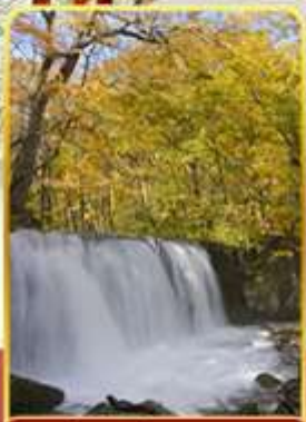
ลำธารโออิราสะ