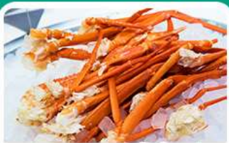
พิเศษ! บุฟเฟ่ต์งาปู