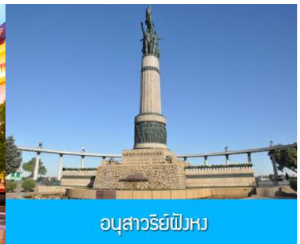
อนุสาวรีย์ผึ้งหง