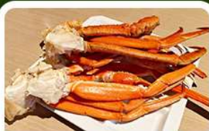
เมนูพิเศษ! หาลู