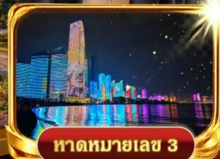
หาดหมายเลข 3