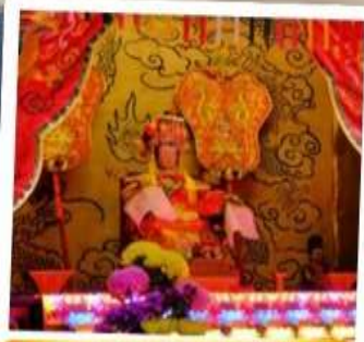
เจ้าแม่ทับทิม จอสเฮ้าส์เบย์