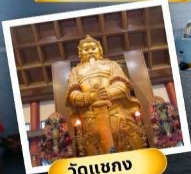
วัดเขากง