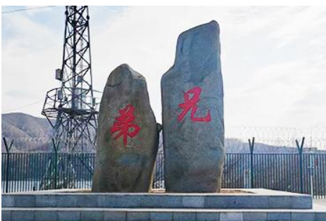
ป้ายพรมแดนจีนเกาหลีและแท่งศิลาสองพี่น้อง