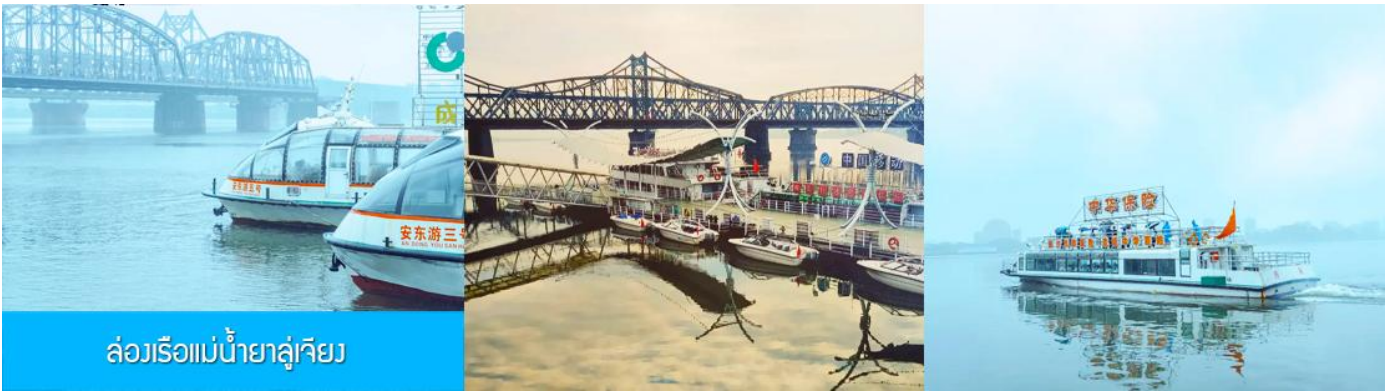
ล่องเรือแม่น้ำยาลู่เจียง

หลังอาหารให้ท่านพักผ่อนตามอัชชาศัยในโรงแรม