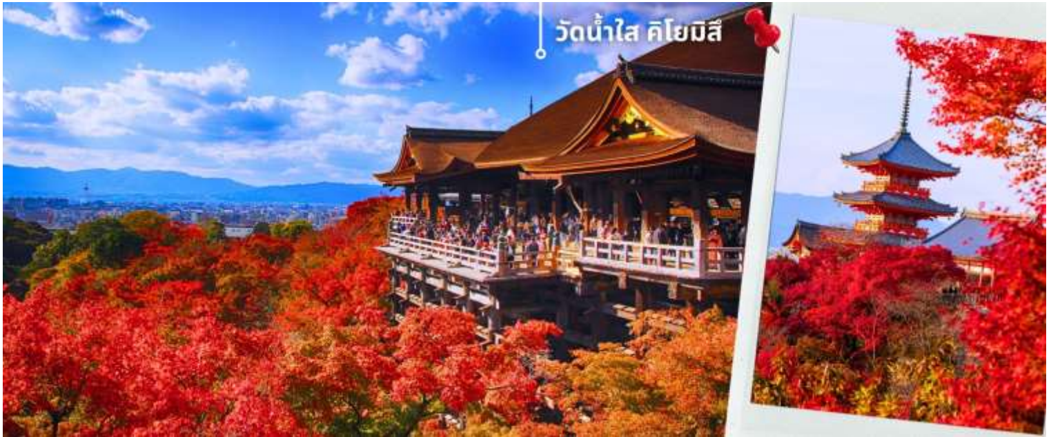
วัดน้ำใส คิโยมิสึ

*ระยะเวลาการเปลี่ยนสีของใบไม้จะขึ้นอยู่กับสายพันธุ์และสภาพอากาศ*