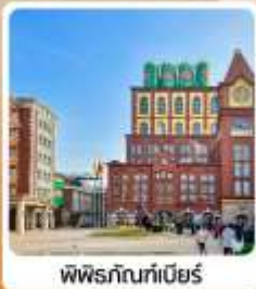
พิพิธภัณฑ์เบียร์