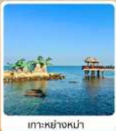
เกาะหย่างหม่า