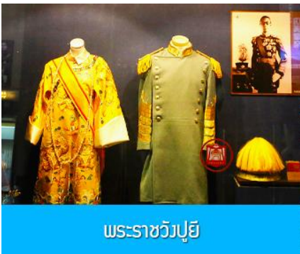
พระราชวังปู้ยี้

เช้า รับประทานอาหารเช้า ณ ห้องอาหารของโรงแรม (7)