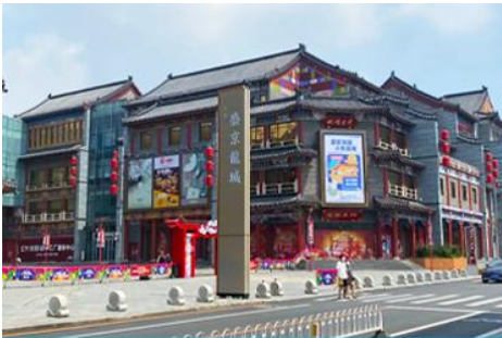
ถนนแมนจูเรีย