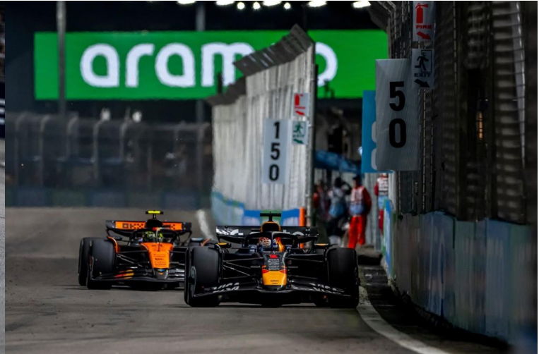
ชม รอบ SPRINT RACE + QUALIFYING