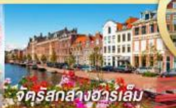
จัตุรัสกลางฮาร์เล็ม