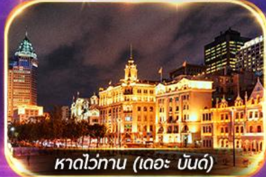
หาดวอทาน (เดอะ บันด์)

เที่ยวดิสนีย์แลนด์เต็มวัน (รวมรถรับ-ส่ง)