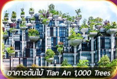
อาคารต้นไม้ Tian An 1,000 Trees