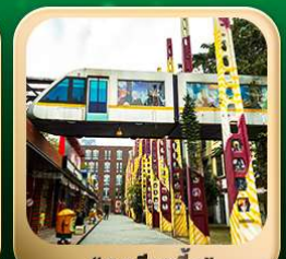
“ดงเจียวจื่อ”