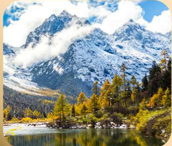
“ปี่ผิงโกว”

T2G-TFU25SL Basic Chengdu...เจิงตู สี่ครุณี ปี่ผิงโกว 4D 3N (SL)