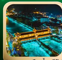
“สะพานหนานเฉียว น้ำคาสีฟ้า”