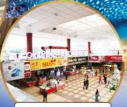
ตลาดกังเป๋ย