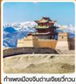
กำแพงเมืองจีนด่านเจี๋ยวีกวน