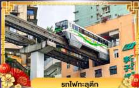
รถไฟฟ้า-ลูตัก