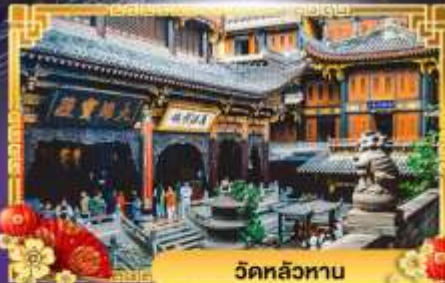
วัดหลิวหวน