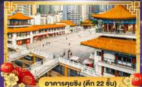
อาคารคุยฉิ่ง (ตึก 22 ชั้น)