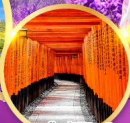
ศาลเจ้าฟุชิมิอินาริ