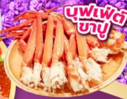
บุฟเฟ่ต์ ซาซึ