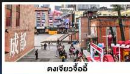
ตงเจียวจื้ออี้