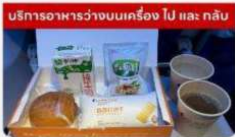
บริการอาหารว่างบนเครื่องบิน ไป และ กลับ