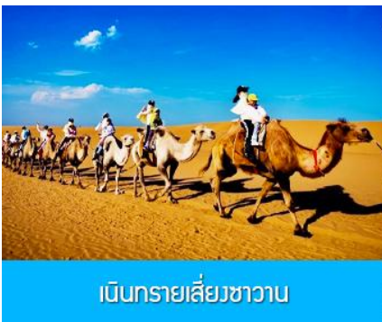
เนินทรายเลี้ยงชวาน

เที่ยง รับประทานอาหารกลางวัน ณ ภัตตาคาร (5)