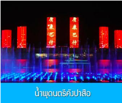
น้ำพุดนตรีคังปาสือ

จากนั้นนำท่านเดินทางกลับสู่ เมืองเออร์ดอส 鄂尔多斯 (ระยะทาง 180 กิโลเมตรใช้เวลาประมาณ 3 ชั่วโมง ) รับประทานอาหารค่ำ ณ ภัตตาคาร (9)