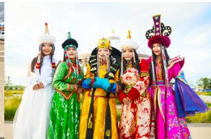
แต่งชุดพื้นเมืองบอโกล