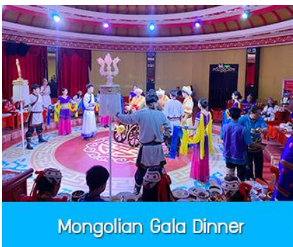
Mongolian Gala Dinner

那达慕 Naadam Festival หรือเทศกาลเฉลิมฉลองที่คล้ายวันตรุษจีนของชาวจีน ประกอบด้วยกิจกรรมการเล่นพื้นเมืองแบบมองโกล รวม 22 อย่าง ได้แก่ พิธีแต่งงานเออร์คอส / การขี่ม้าในสนาม / ปาร์ตี้รอบกองไฟ / ขี่ม้าถ่ายรูป / ไล่ไลเดอร์หญ้า / รถลางทุ่งหญ้า / สวนแขวงกต/สวนเด็กเล่น / ตีกอล์ฟทุ่งหญ้า / รถบังคับ / รถโกคาร์ต / โยนบอลทุ่งหญ้า / ปั่นไฟมองโกล / ยิงธนูในร่ม / แข่งขันจับแกะ / คล้องม้าจำลอง / หมูเลี้ยงน้ำเอ็นดู / เครื่องเล่นหมุน / เลี้ยงแกะโยน / ยิงธนู / ทอยแจกัน / เซ็นต์ชื่อภาษา มองโกล ให้เลือกเล่นได้ 12 อย่างตามรายการที่ระบุ.....อัตราค่าบริการสำหรับ 那达慕 Naadam Festival 380 หยวน หรือ 1,900 บาท/ท่าน (สำหรับลูกค้าทัวร์ที่ไม่ซื้อโปรแกรมเสริม สามารถเดินเล่น ถ่ายรูปบริเวณทุ่งหญ้าหรือพักผ่อนตามอัธยาศัย)