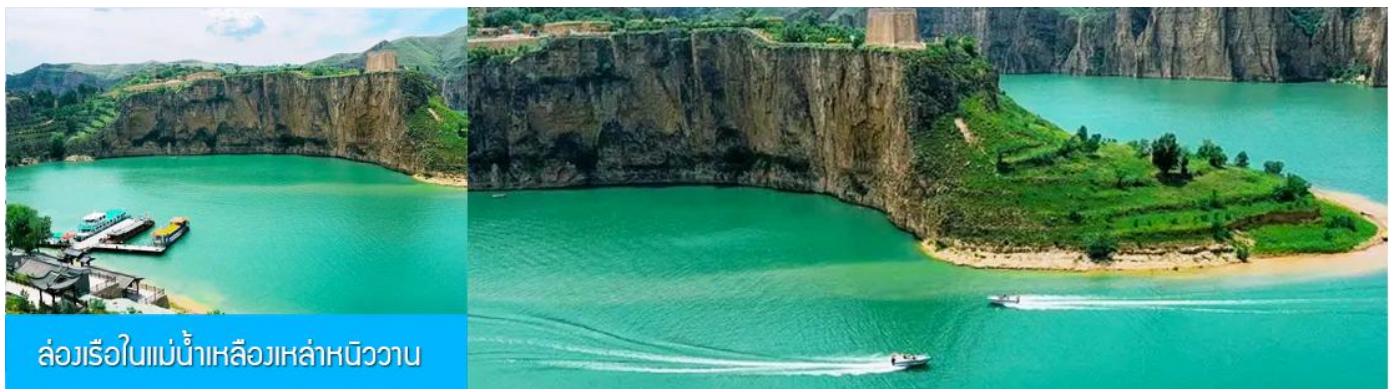
ล่องเรือในแม่น้ำเหลืองเหล่าหนิววาน

เที่ยง รับประทานอาหารกลางวัน ณ ร้านอาหารระหว่างทาง (8)