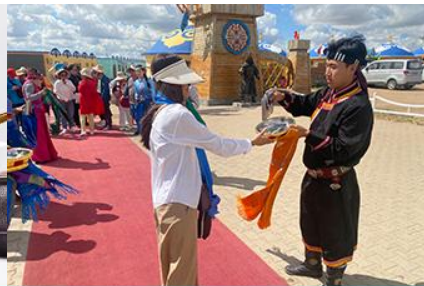
พิธีต้อนรับแขกด้วยเหล้า