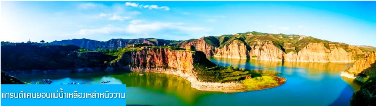
แกรนด์แคนยอนแม่น้ำเหลืองเหล่าหนิววาน

พักที่ DALATEQI SHNAGJING HOTEL โรงแรมระดับ 4 ดาวหรือเทียบเท่าในเมืองต้าลาเท่อ