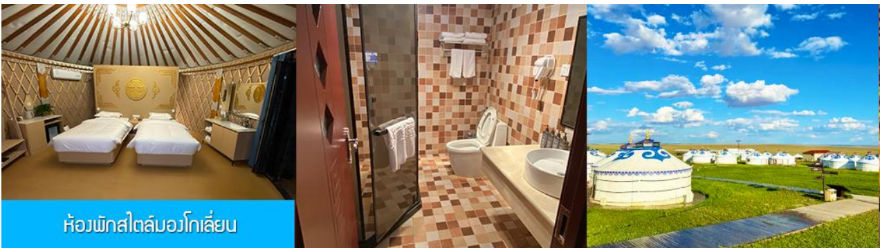
ห้องพักสไตล์มองโกลเลียน