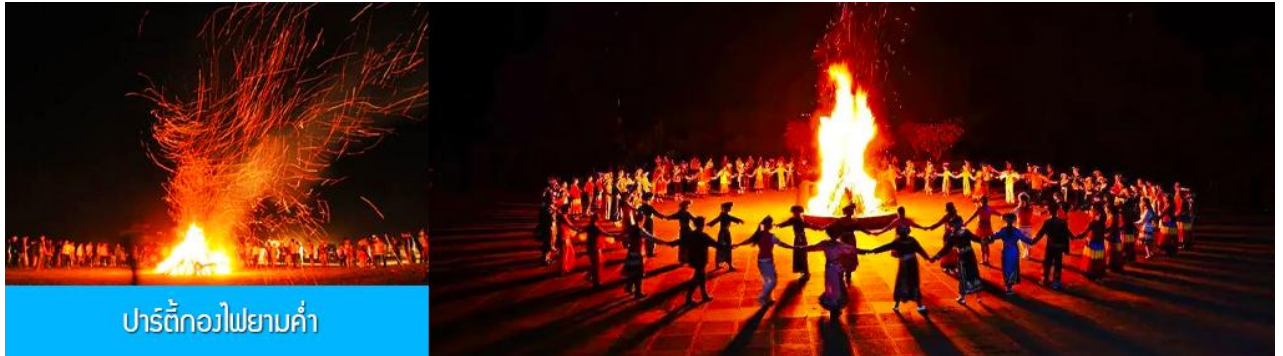
ปาร์ตี้กองไฟยามค่ำ