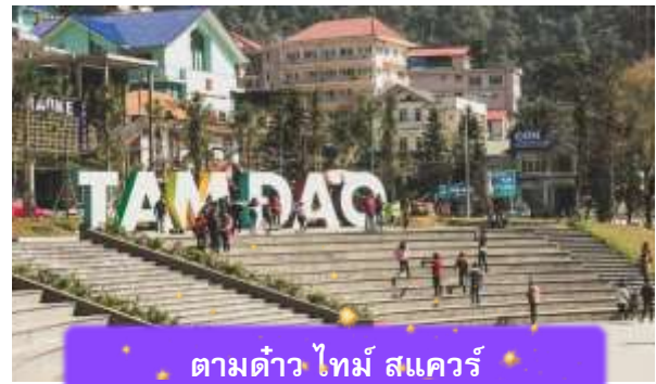
ตามด้าว ไทม์ สแควร์

เช็คอิน ตามด้าว ไทม์ สแควร์ ที่นี่เป็นฟิลสวอนสาธารณะกลางเมือง เป็นพื้นที่ที่ชาวตามด้าวใช้พักผ่อนกันเป็นลานน้ำพุกว้าง ๆ ที่มองเห็นเมืองโดยรอบ ซึ่งรอบๆจัตุรัสนี้ก็จะมีร้านค้า คาเฟ่ ร้านอาหาร และมีมุมถ่ายรูปน่ารักๆ เหมาะสำหรับการถ่ายรูป นำท่านเดินทางกลับ เมืองฮานอย