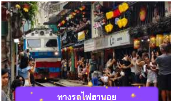
ทางรถไฟฮานอย

เช้า บริการอาหารเช้า ณ ห้องอาหารของโรงแรม หลังจากนั้นนำท่านเดินทางสู่ ทางรถไฟฮานอย เป็นแหล่งท่องเที่ยวที่ได้รับความนิยมในกรุงฮานอย ประเทศเวียดนาม. จุดเด่นของที่นี่คือทางรถไฟที่วิ่งผ่านย่านชุมชนที่อยู่อาศัย ทำให้เกิดภาพวิถีชีวิตที่แปลกตาและเป็นเอกลักษณ์ ท่านสามารถทดลองชิมกาแฟแท้ๆจากเวียดนามได้ที่นี้ อาทิ กาแฟนมเวียดนามที่มีความเข้มข้น กาแฟไข่นุ่มนวลหอมละมุน หรือกาแฟเกลือที่ทำให้ความรู้สึกแปลกแต่อร่อยอย่างบอกไม่ถูก ( ไม่รวมค่าเครื่องดื่ม )