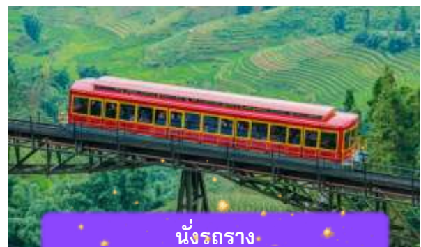
นั่งรถราง

เที่ยง บริการอาหารกลางวัน ณ ภัตตาคาร พิเศษ ... เมนูบุฟเฟ่ต์ฟานซีปัน