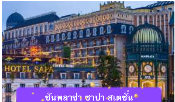
ชั้นพลาซ่า ซาปา สเตชั่น