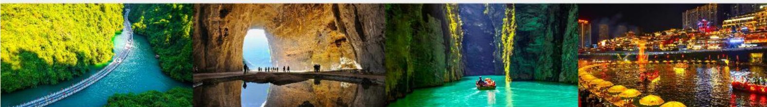
หุบเขาสิงโต