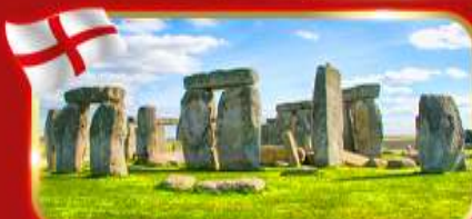
สโตนเฮนจ์ สิ่งมหัศจรรย์ของโลก