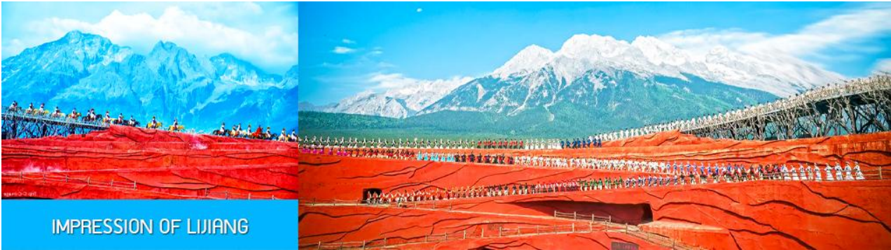
IMPRESSION OF LIJIANG

ชมการแสดง IMPRESSION OF LIJIANG การแสดง ณ เวทีการแสดงกลางแจ้งอันยิ่งใหญ่โดยผู้กำกับชื่อดังของโลก จางอวี๋โหมว ที่ได้ทุ่มเทพฝีมือเนรมิตให้ภูเขาหิมะมังกรหยกเป็นฉากหลัง และสร้างเวทีกลางและอัฒจันทร์กลางแจ้งเพื่อใช้ในการแสดง โดยใช้ทีมงานนักแสดงกว่า 600 ชีวิต ประกอบด้วยระบบแสง สี เสียง พร้อมการแต่งกายของเครื่องแต่งกายพื้นเมืองของเหล่านักแสดง โดยถ่ายทอดเรื่องราวชีวิตความเป็นอยู่ และชาวเผ่าต่างๆ ของเมืองลี่เจียงผ่านการแสดงในชุดต่าง ๆ