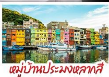
หมู่บ้านประมงเหลกาสี