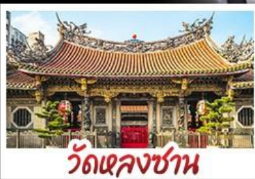
วัดเจหลงซาน