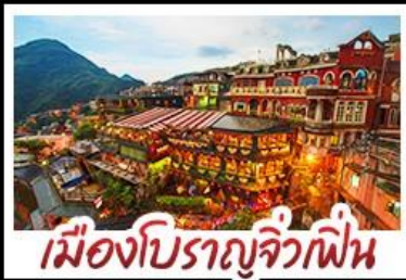
เมืองโบราณจิวเฟิน