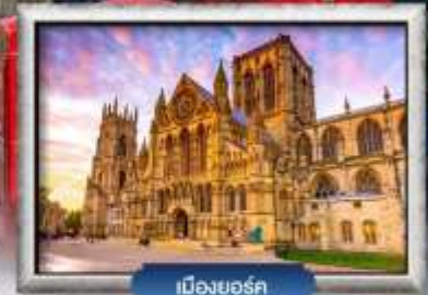
เมืองยอร์ก