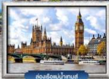
ล่องเรือแม่น้ำเทส