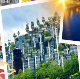
Tian An 1000 Trees