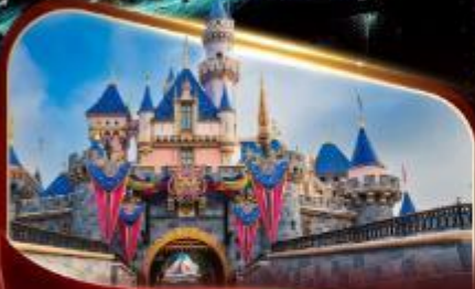
ดิสนีย์แลนด์ปาร์ค