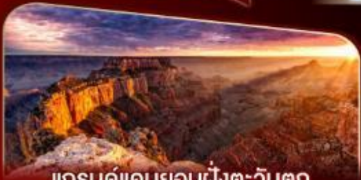
แกรนด์แคนยอนฝั่งตะวันตก