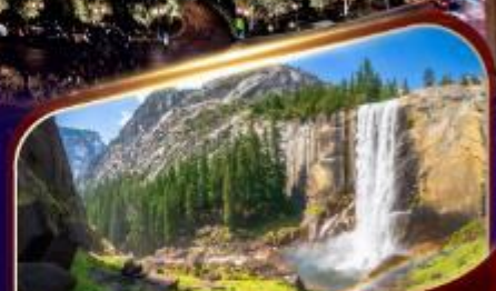
อุทยานแห่งชาติโยเซมิตี