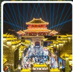
เมืองโบราณซีงหยาง