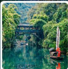
หมู่บ้านชาเมี่ยหมื่นเจีย