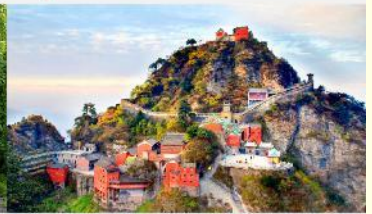
อุทยานเขาวู้ต้ง

*ทางบริษัทฯ ขอสงวนสิทธิ์ในการสลับโปรแกรมทัวร์ตามความเหมาะสมขึ้นอยู่กับสถานการณ์หน้างาน โดยคำนึงถึงผลประโยชน์ของลูกค้าเป็นสำคัญ