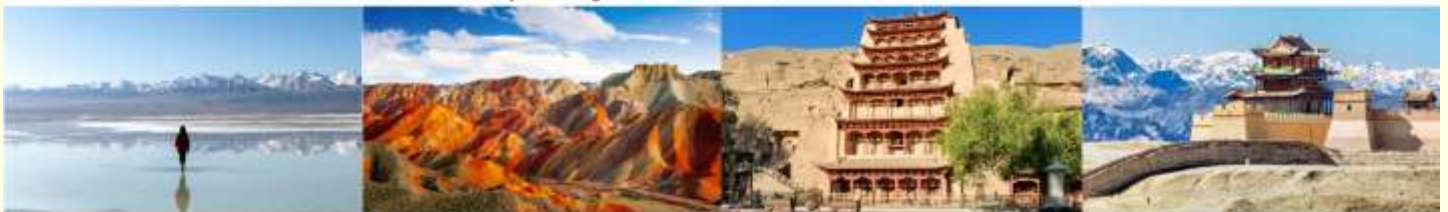
ทะเลสาบชิงไห่