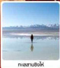
ทะเลสาบชิงไห่