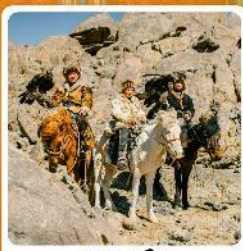
ชาวมองโกล