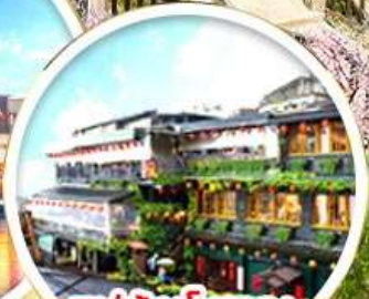
หมู่บ้านโบราณ จิวเฟิน