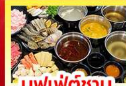
บุฟเฟ่ต์ซาบู