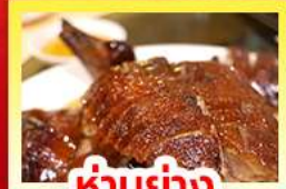
ห่านย่าง