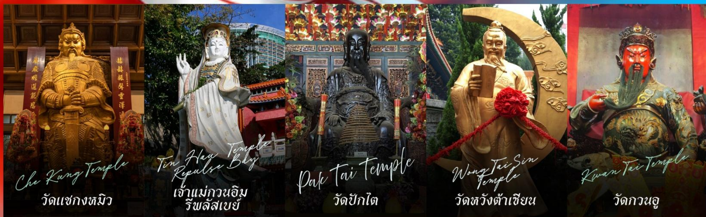
Che Kung Temple วัดแชงทมิว

รายการทัวร์ข้างต้นอาจมีการปรับเปลี่ยนเพื่อความเหมาะสม