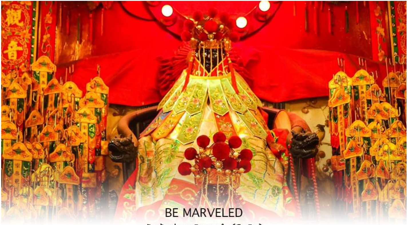
BE MARVELED วัดเจ้าแม่กวนอิมฮองอ่า (ยิมวิน)

ที่จัดขึ้นในทุกๆปี พิธีนี้จะมีเพียงครั้งปีละครั้งเท่านั้น เป็นวันสำคัญอีกวันที่คนหลังไหลมาไหว้ขอพรอย่างไม่ขาด สาย