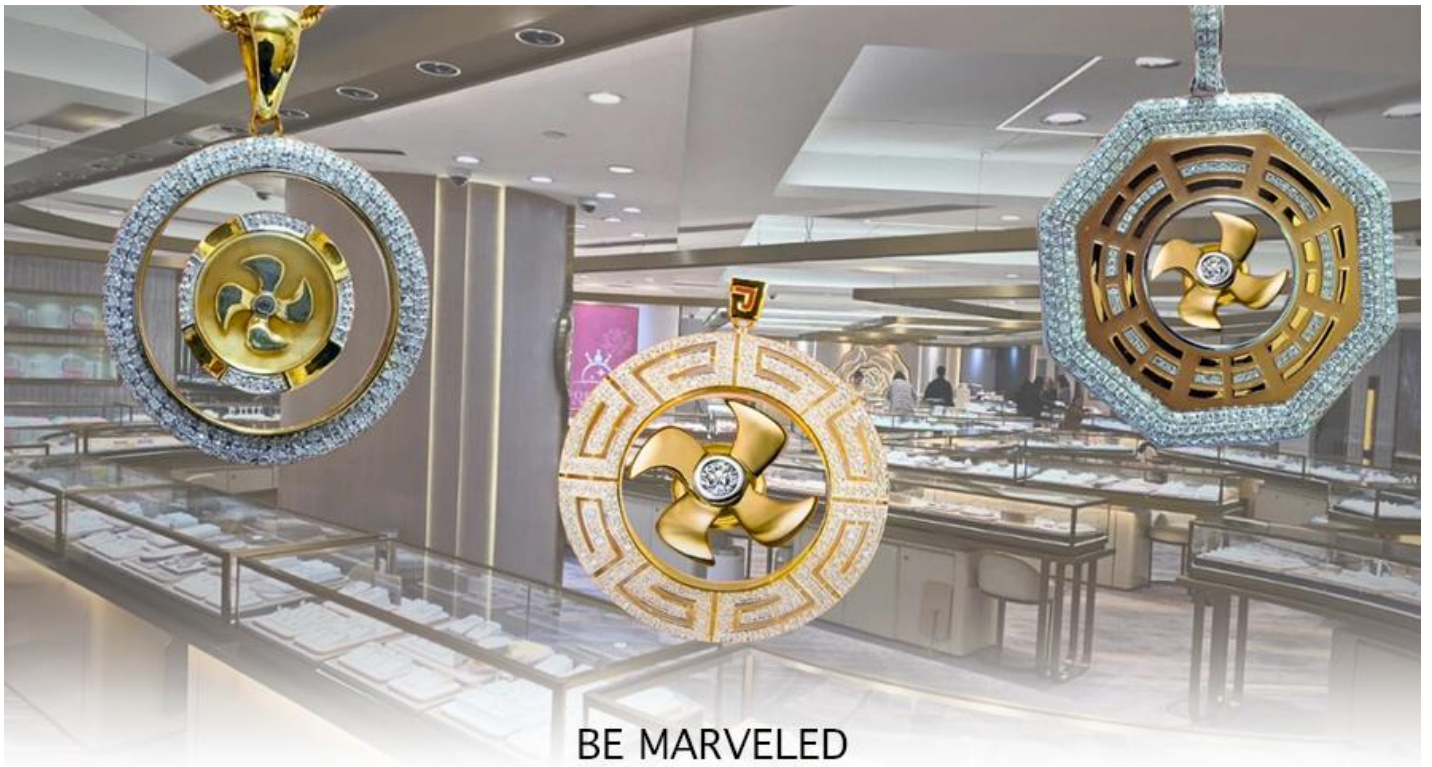
BE MARVELED ศูนย์ฮวงจุ้ย กังหันเศรษฐี

และนำท่าน ชม ศูนย์ปีเซี่ยะ ซึ่งคนจีนนั้น ถือว่าหยกเป็นหิน ที่เป็นตัวแทนของความสวยงามและความบริสุทธิ์ มีความเชื่อว่าหยก มงคล ถ้าพกติดตัวไว้จะอายุยืนและสุขภาพดีมีสินค้ามากมายเกี่ยวกับหยก อาทิ กำไลหยก หรือ สัตว์นำโชคอย่างปีเซี่ยะ ให้ท่าน ได้เลือกซื้อเป็นของฝาก, ของที่ระลึก หรือของนำโชคแต่ตัวท่านเอง