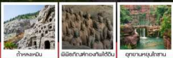
ท่าหลงเหนิน พิพิธภัณฑก์องทัพใต้ดิน อุทยานหยุนโกซัน