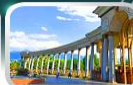
1st President Park