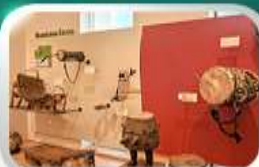
Museum of Folk Instrument