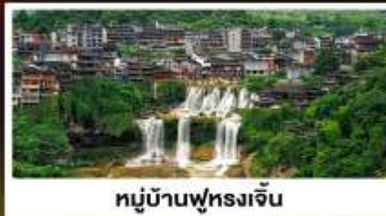
หมู่บ้านฟุทงเจิน