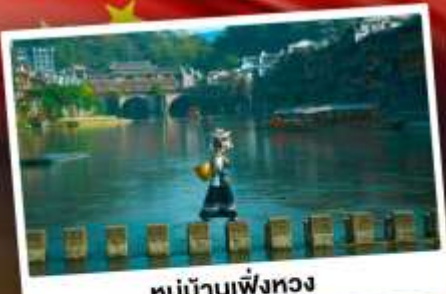
หมู่บ้านเฟิ่งทง

สุดคุ้ม!! พัก 5 ดาว ทุกคืน มนตร์เสน่ห์เมืองเก่า ริมสาងน้ำแจ่มใสแดน