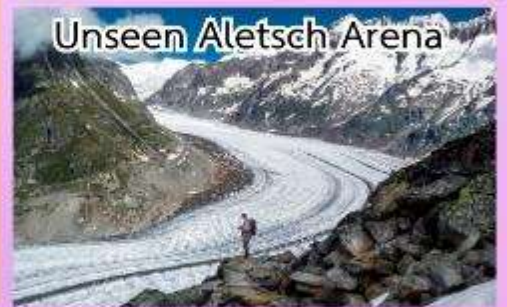
Unseen Aletsch Arena

ชมความงดงามของทะเลสาบเจนีวา ชมปราสาทชิลองที่เมืองมอว์คเทออร์ช ล่องเรือชมความงามของทะเลสาบ ลูเซิร์น, พักในหมู่บ้านเซอร์แมท (เมืองตากอากาศปลอดมลพิษ ที่ได้ ชื่อว่าสวยงามเหมือนสวรรค์บนดิน)