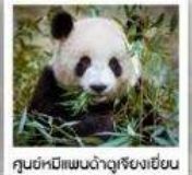
ศูนย์หมีแพนด้าดูเจียงเยียน