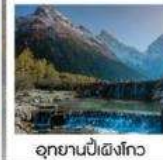
อุทยานปี้เพิงโกว