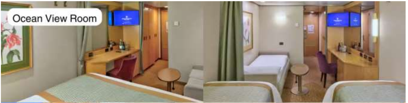
Ocean View Room