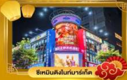
ช้อปปิ้งไนท์มาร์เก็ต