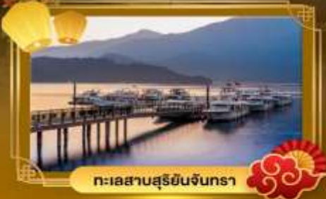
ทะเลสาบสุริยจันทร์