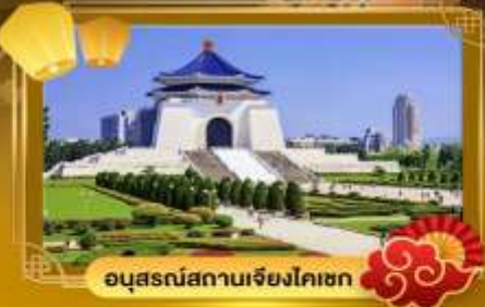
อนุสรณ์สถานเจียงไคเชก