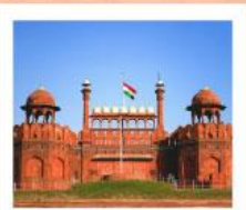
♥♦♦ Agra Fort