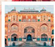
♥♦♦ Amber Fort