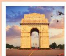
♥♦♦ India Gate